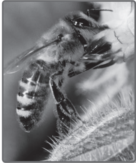
OVS: Fleissig wie die Bienen...