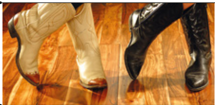
Line-Dance mit «No Limits Dance-Factory» www.nolimitsdancefactory.ch

von Rock'n'roll über Beat und Country mit einer guten Portion Blues und Rock vermischt; das ist Private Stock. In den Bandpausen serviert unser Bachfest-DJ Hits für jung und alt.